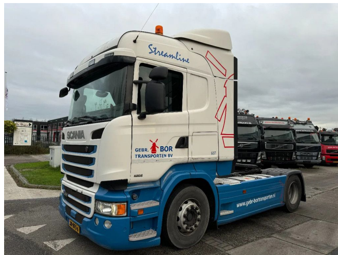
Scania R410 4X2 - EURO 6 + RETARDER + FULL SPOILER ...