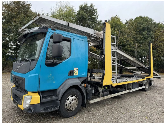
Volvo FL 280 4X2 - *TIK IN DE MOTOR* + EURO 6 + WINCH