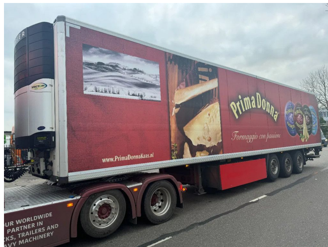
Krone SD + CARRIER VECTOR 1850 + DHOLLANDIA 3X S...