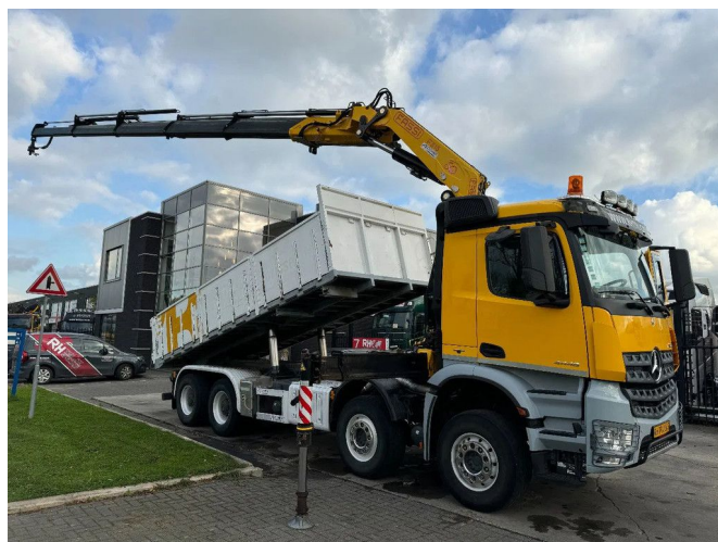
Mercedes-Benz Arocs 4448 8X4 + EURO 6 + FASSI F315 + ...