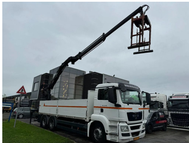
MAN TGS 26.440 6X4 - EURO 5 + HIAB 166K PRO + KINS...