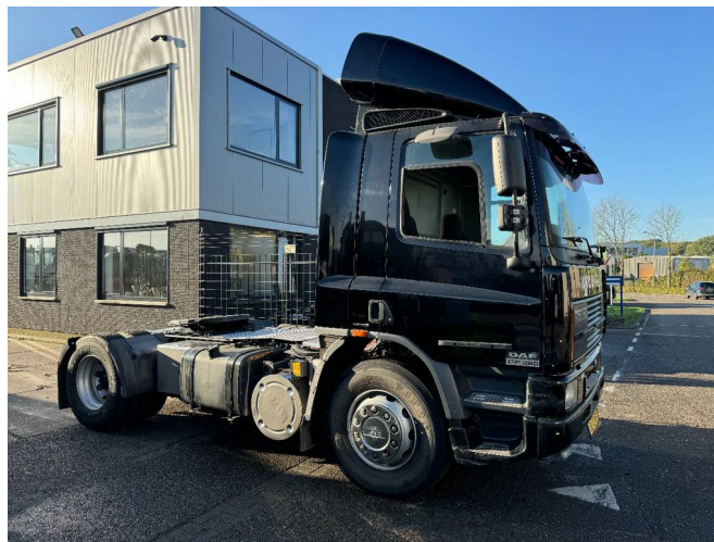
DAF CF 75.290 4X2 EURO 3 MANUAL GEAR + VANGMUIL