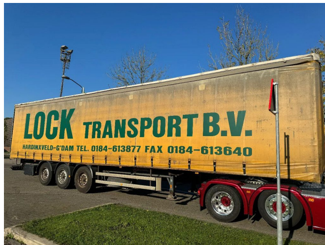
Samro ST39WG + 3X BPW AXLE