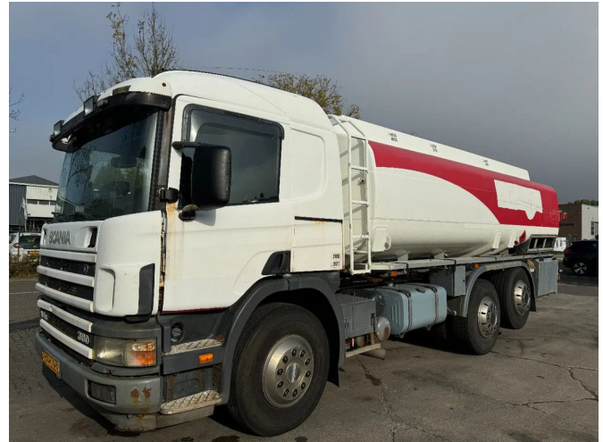
Scania P114-380 6X2 - EURO 3 + 3 CAMBER + RETARDER ...