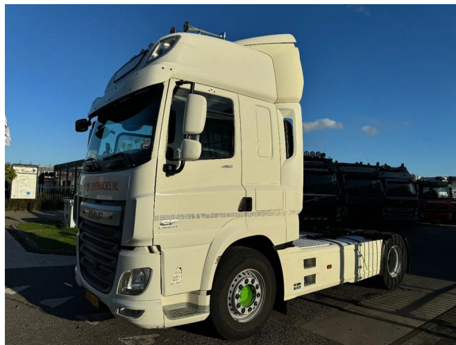
DAF CF 460 4X2 - EURO 6 + FULL SPOILER