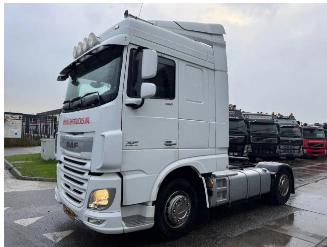
DAF XF 460 4X2 - EURO 6 + NL TRUCK