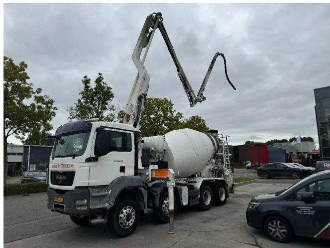
MAN TGS 35.400 8X4 PUTZMEISTER PUMP 21-3 + LIEBH...