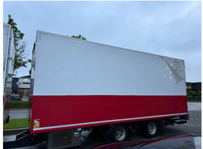
Burg M-2-18 - 2 AXLE BPW + CARRIER TRS + DHOLLANDIA...