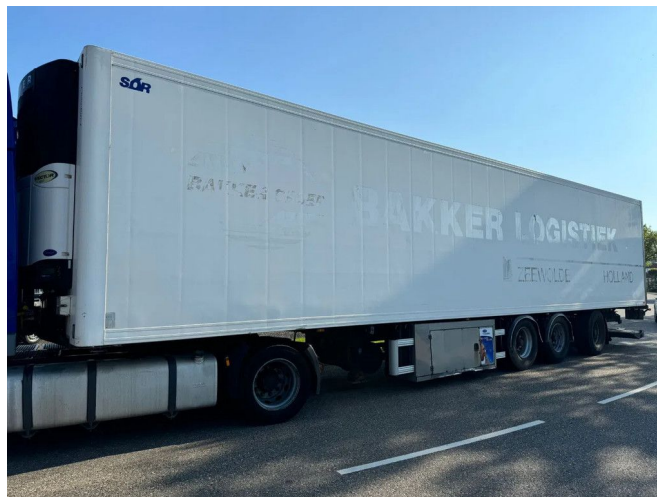
Sor 3 AS + CARRIER VECTOR 1850 + LOADLIFT + STEERI...