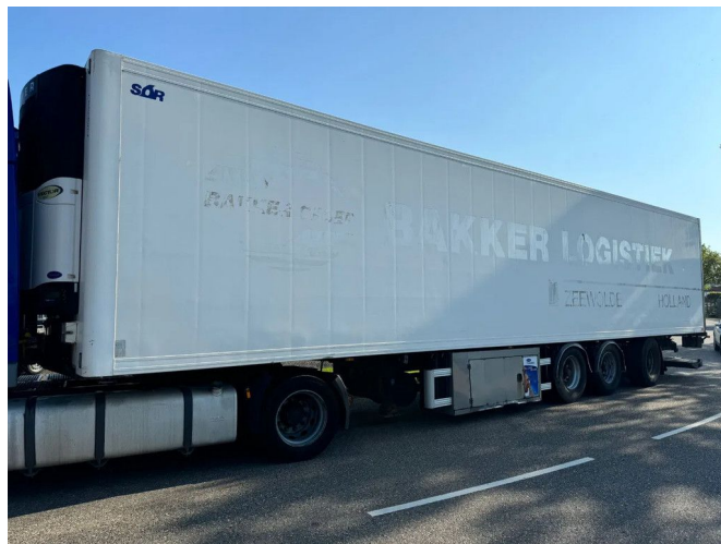
Sor 3 AXLE + CARRIER 1850 D/E