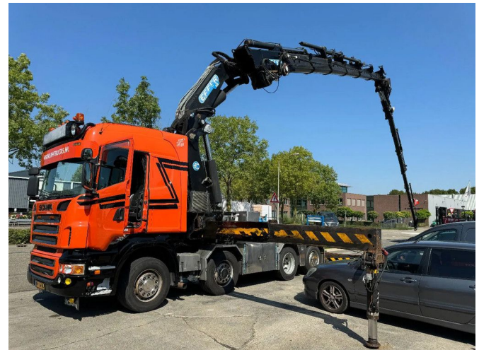
Scania R560 V8 8X2 + EFFER CRANE 1550 6S + FLYJIP 6...