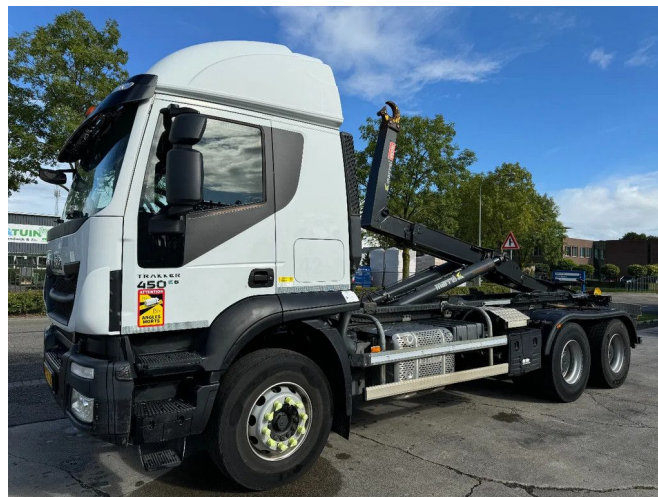
Iveco Stralis 450 6X2 - EURO 6 + MARREL HOOK