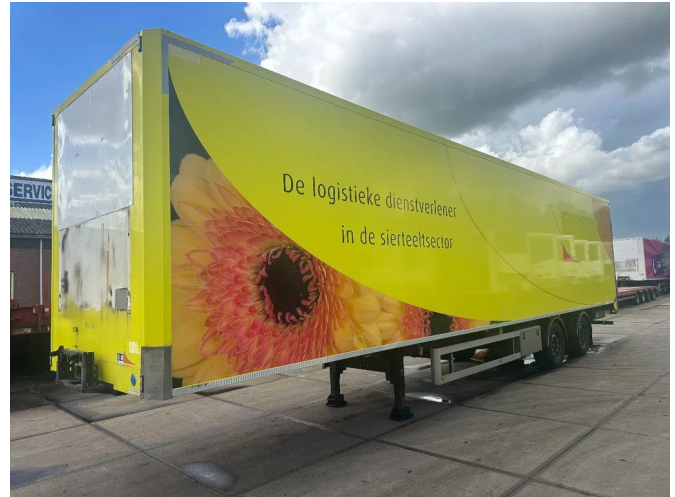
H.T.F. 1e AS LIFT 2e STUUR 13,5 X 2,5 X 2,74M