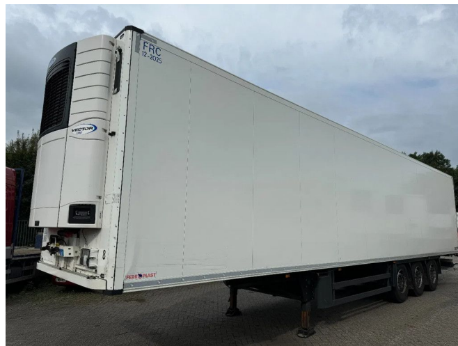
Schmitz Cargobull SCB S3B - 3 AXLE - CARRIER VECTOR ...