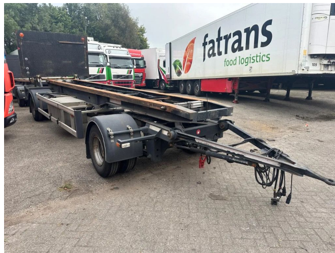
Burg BPA 10-10 ARXXX 2X BPW AXLE