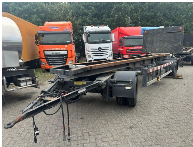
Burg BPA 10-10 ARXXX 2X BPW AXLE