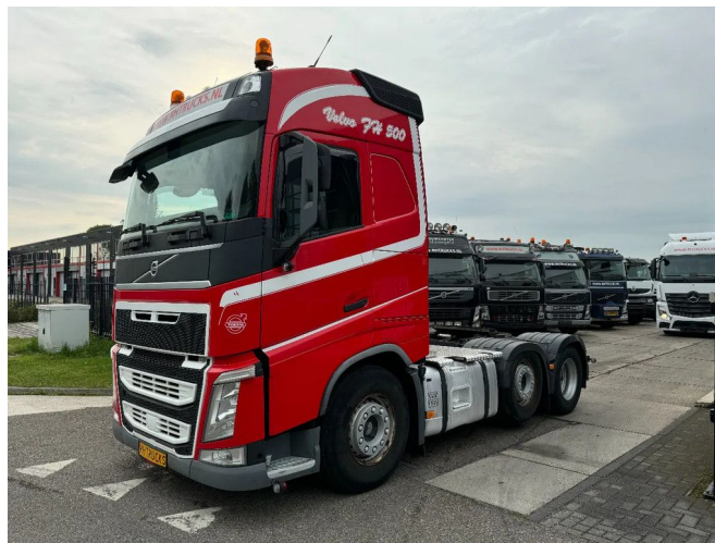
Volvo FH 500 6X2 AUTOMATIC STEERING AXLE