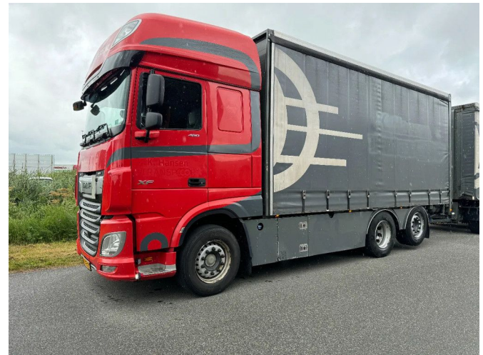
DAF XF 480 6X2 EURO 6 2018AUTOMATIC