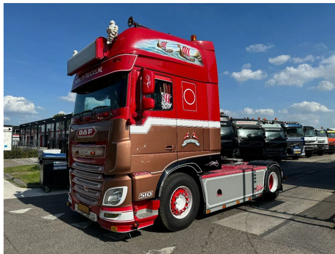
DAF XF 510 4X2 EURO 6 SHOW TRUCK