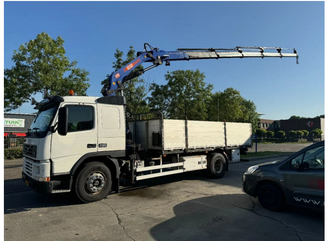
Volvo FM 7.290 4X2 EURO 2 + PM 22SP5 + REMOTE CON...