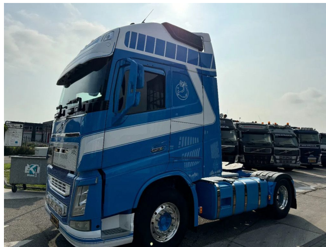
Volvo FH 460 4X2 - EURO 6 + ADR