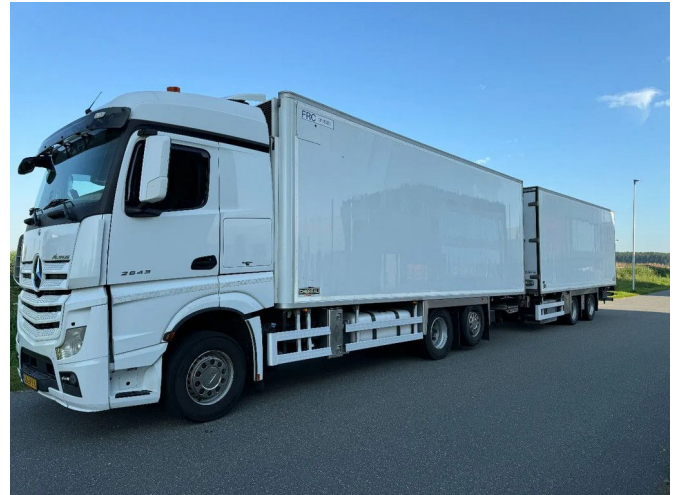
Mercedes-Benz Actros 2643 6X2 - EURO 6 + CHEREAU HA...