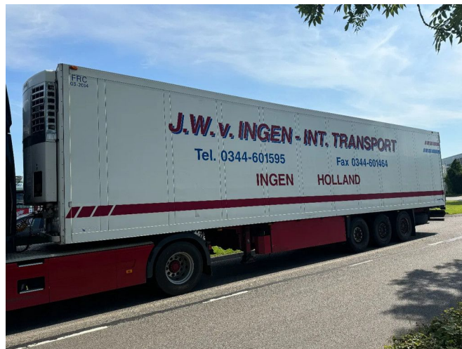
Schmitz Cargobull SKO 24 - 3 AXLE - SAF + THERMOKING ...