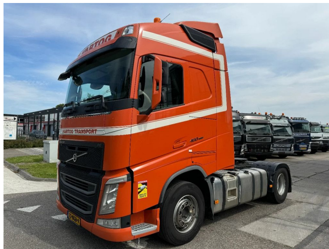
Volvo FH 460 4X2 - EURO 6 + APK 06-2025