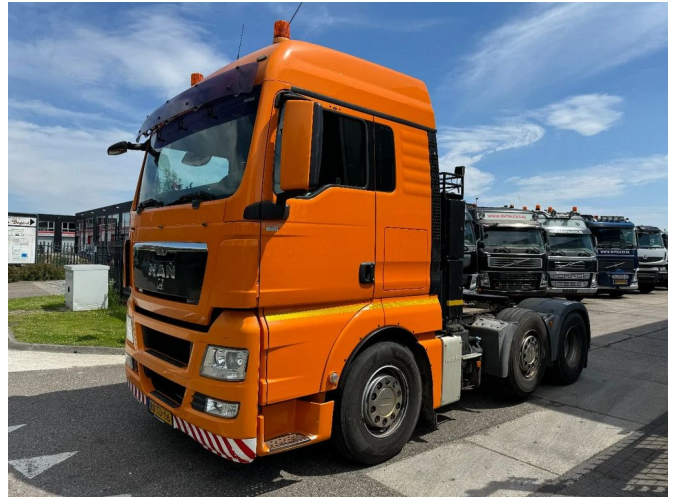
MAN TGX 26.440 6X2 - EURO 5 + STEERING AXLE