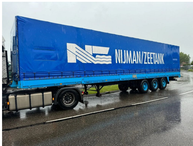
Burg BPDO 12-27 3X SAF AXLE