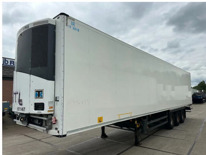
Schmitz Cargobull 15 UNITS THERMO KING SLXE200 BPW...