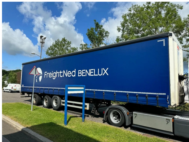
Pacton B3-001 - 3 AXLE - BPW + STEERING AXLE + LIFT A...