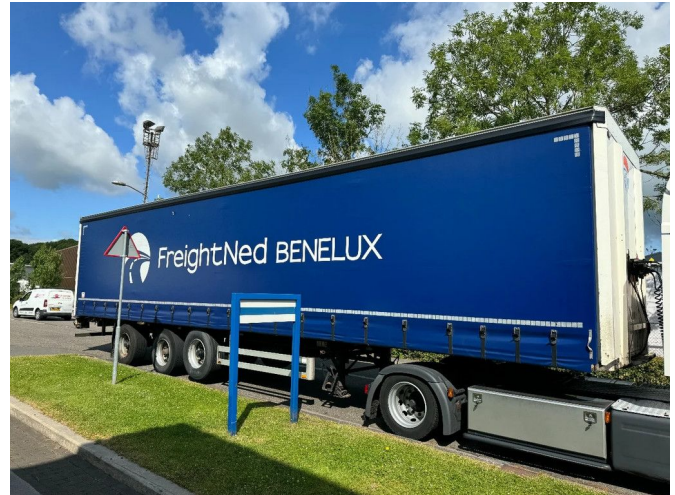
Pacton B3-001 - 3 AXLE - BPW + STEERING AXLE + LIFT A...