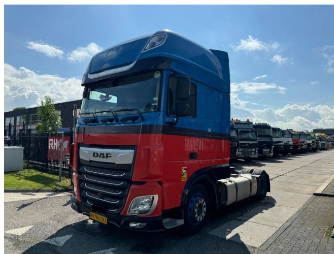
DAF XF 450 4X2 - EURO 6 - MEGA