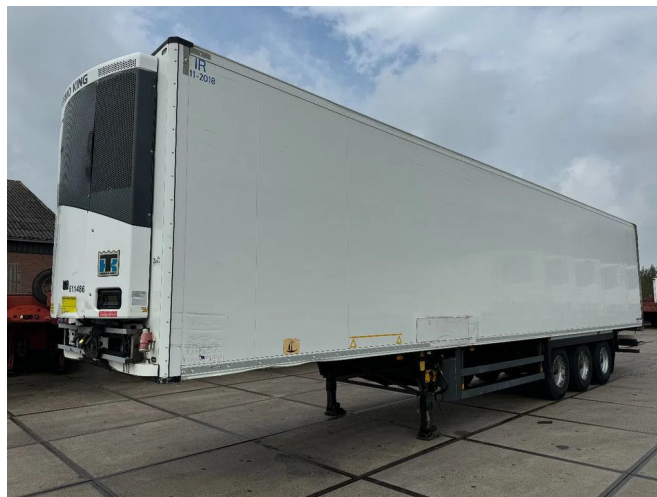
Schmitz Cargobull THERMO KING SLXE200 BPW AXLE