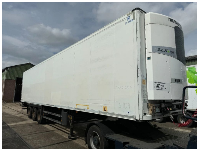
Schmitz Cargobull 15 UNITS THERMO KING SLXE200 BPW...