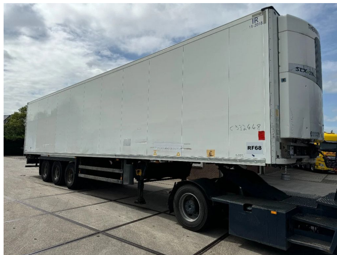
Schmitz Cargobull 15 UNITS THERMO KING SLXE200 BPW...