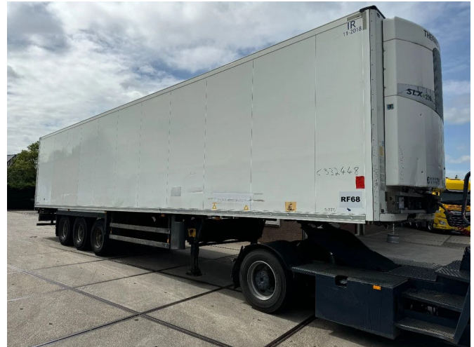
Schmitz Cargobull 15 UNITS THERMO KING SLXE200 BPW...