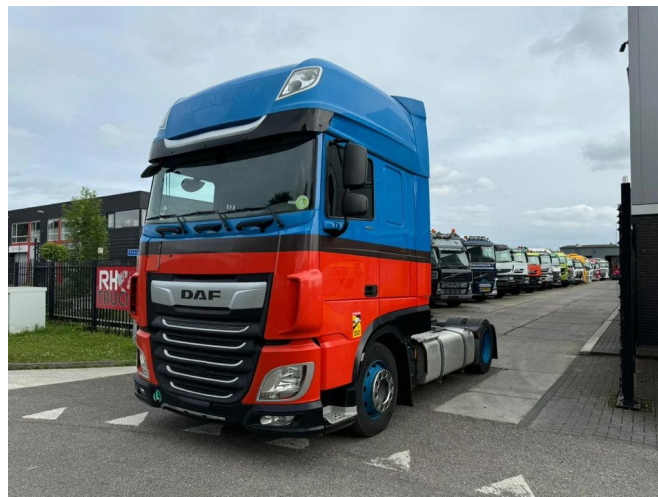
DAF XF 450 4X2 - EURO 6 - MEGA