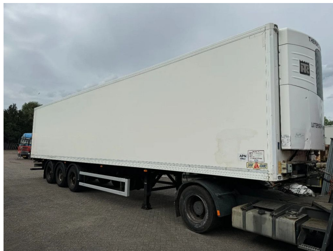
Gray and Adams 2SLX 200 D/E, BPW AXLES