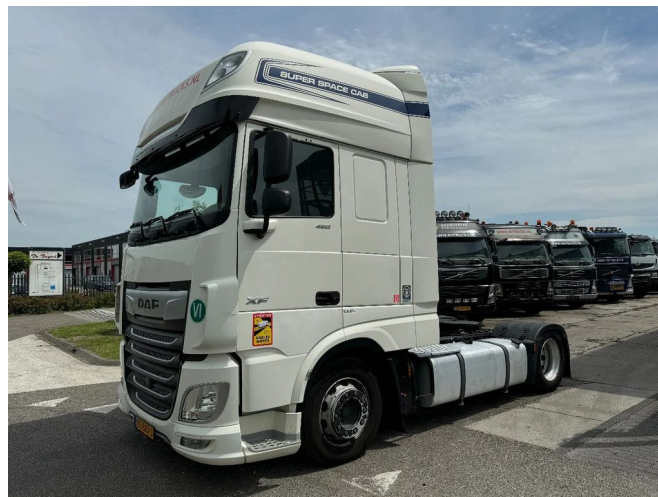
DAF XF 480 4X2 EURO 6 MEGA STANDCLIMA