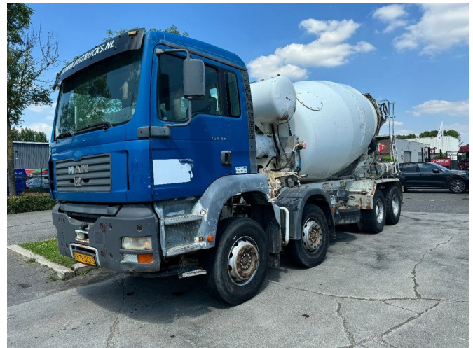
MAN TG 360 A CIFA 10 CBM FULL STEEL MANUAL