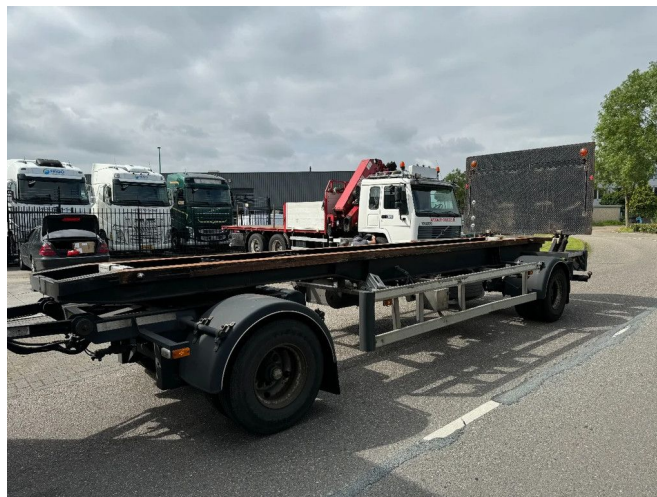
Burg BPA 10-10 ARXXX 2X BPW AXLE