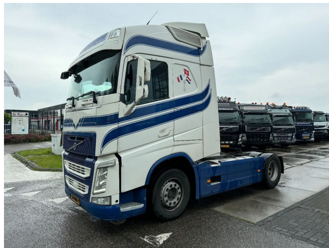
Volvo FH 500 4X2 EURO 6 I SHIFT + I PARK COOL HYDRA...