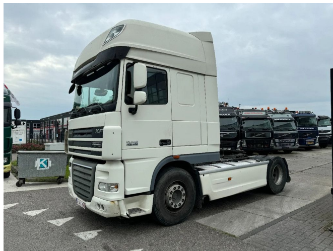
DAF XF 105.460 4X2 EURO 5 HYDRAULIC