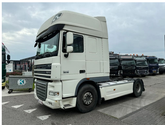
DAF XF 105.460 4X2 EURO 5 HYDRAULIC