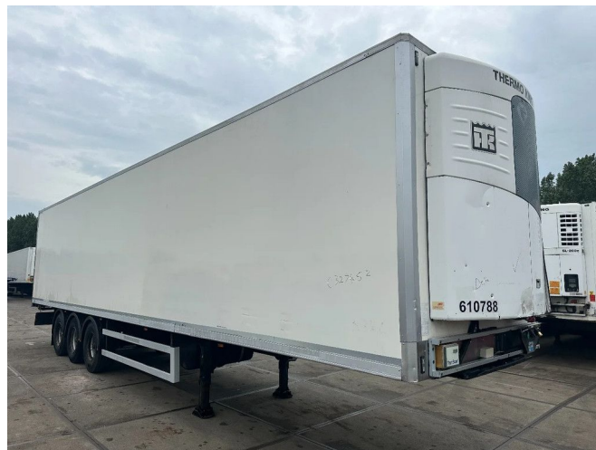
Montracon THERMO KING SLX 200 BPW DRUM BRAKES