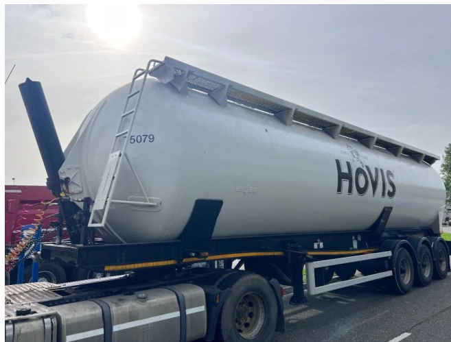
SPITZER SK2458 SILO 58.000L