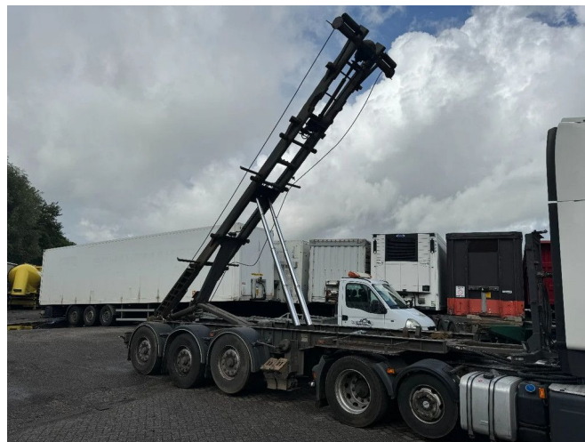
Van Hool CABLE AND KIPPING SYSTEM 3X BPW AXLE FR...