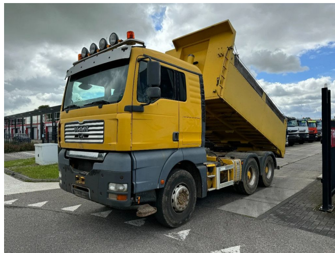
MAN TGA 26.530 6X4 MANUAL 3 PEDALS